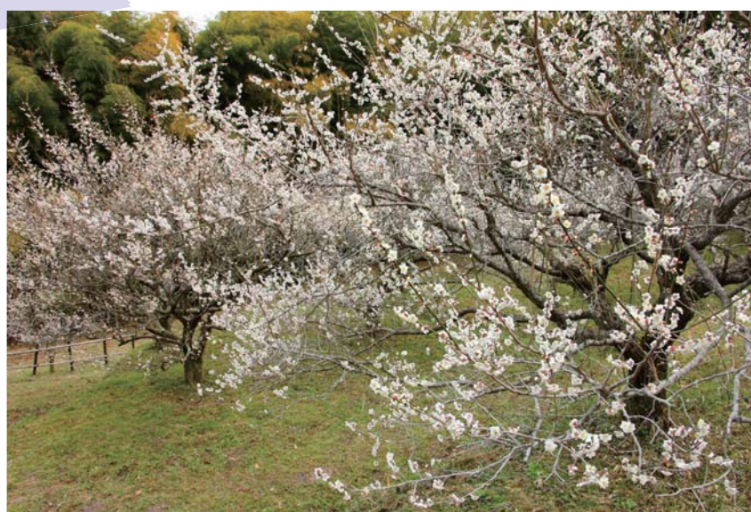
余田臥龍梅(柳井市)