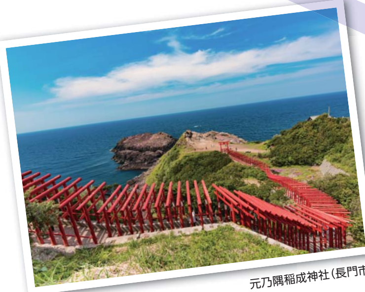
元乃隅稲成神社(長門市)